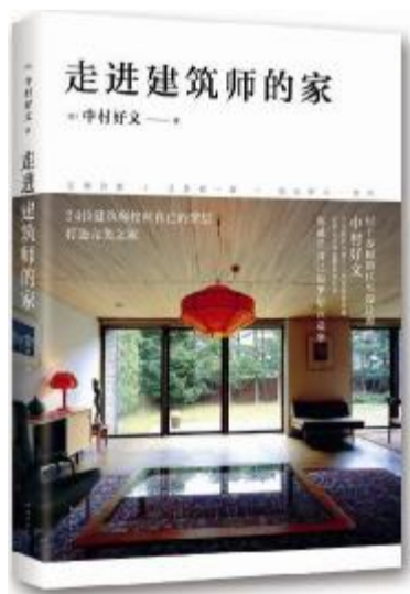
作者：中村好文 出版社：南海出版社