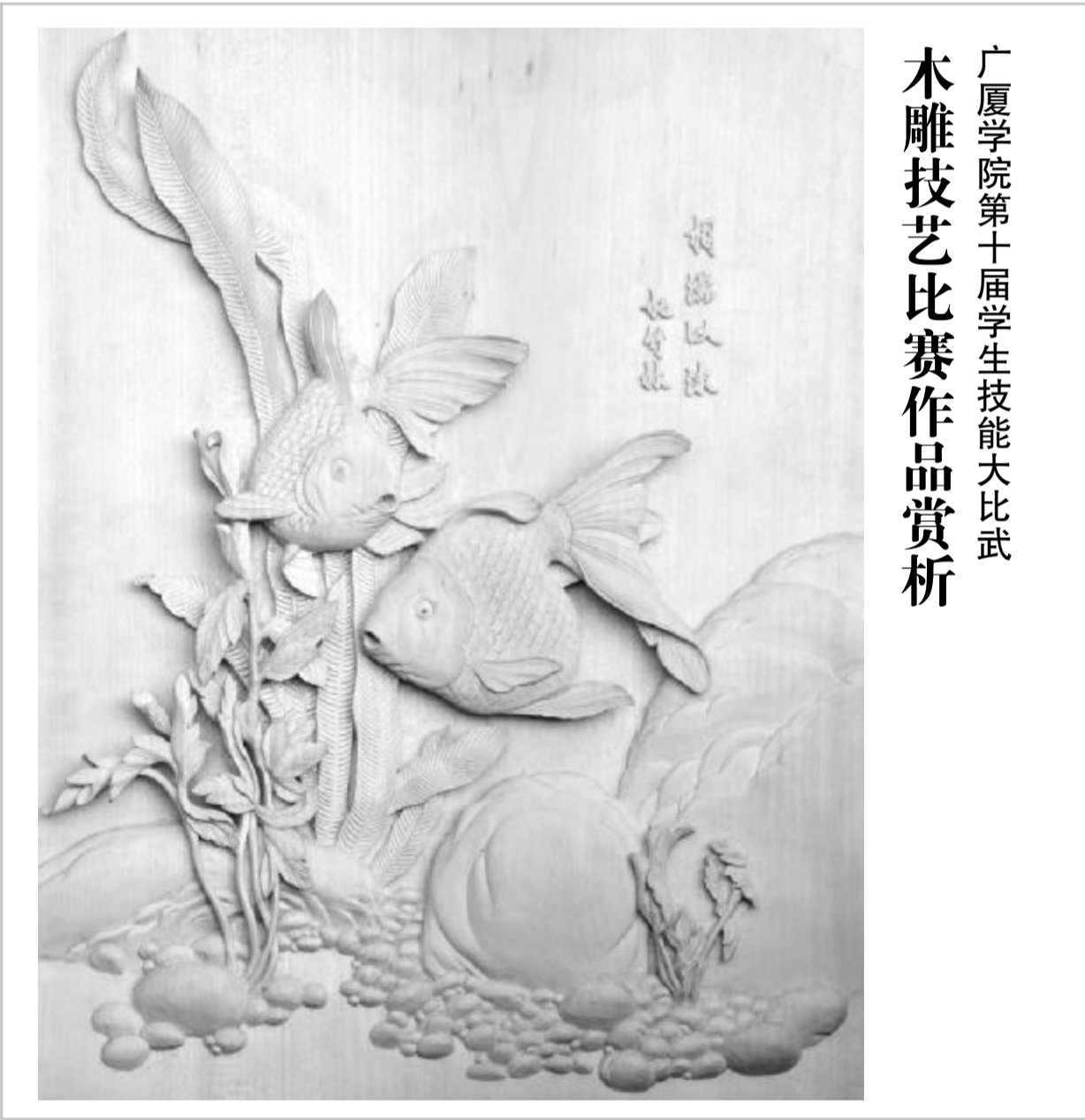
广厦学院第十届学生技能比武 木雕技艺比赛作品赏析