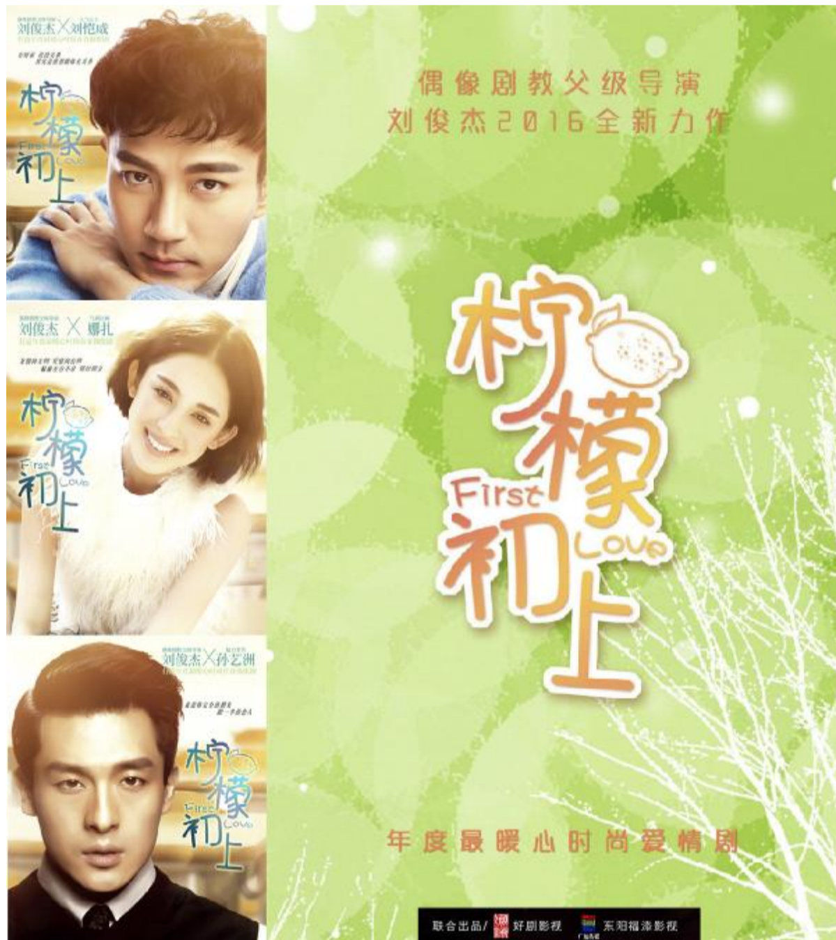
(相关内容见本报四版)

福添影视作为打造广厦大文化产业的主力军,早在创业初期就顺应国家政策和市场变化,并抓住发展机遇,近年来连续拍摄了《妻子的秘密》、《追鱼传奇》、《凤穿牡丹》、《成长》等一大批脍炙人口的影视作品。特别是今年以来,福添影视大规模全面出击,其影视片投拍、金银、合作的立体发展态势令业界内外关注。