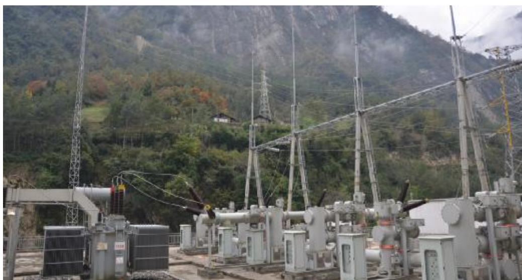
2014年11月，开坪水电站成功并网运行，图为开坪水电站升压站。

2015年，全体能源人将进一步增强加快发展的紧迫感和责任感，进一步坚定信心，振奋精神，鼓足干劲，勇攀高峰，力争早日建成具有重要影响力的综合性国际能源集团公司，为实现“双百广厦”的宏伟目标贡献力量。