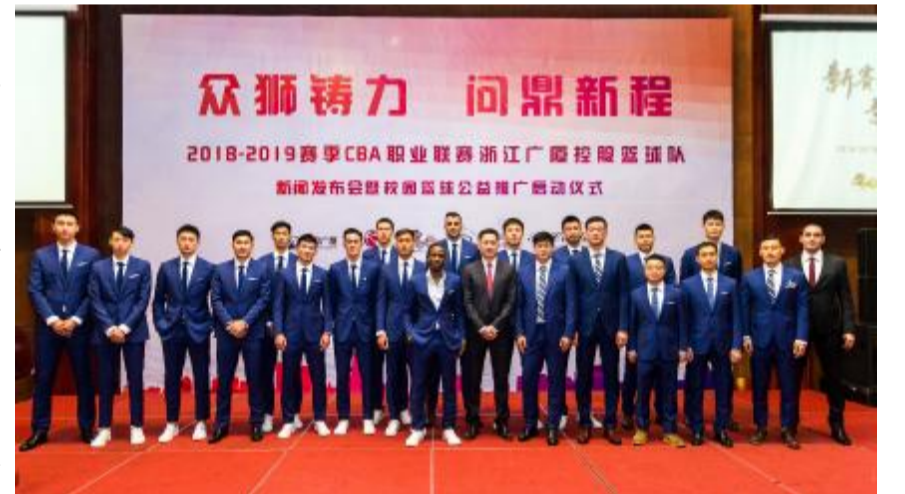
暨校园篮球公益推广启动仪式 众狮铸力 问鼎新程